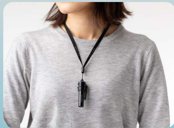
専用ストラップ付