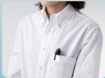
クリップ付 (取り外し可)